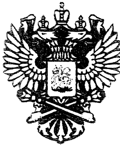
РИСУНОК НАГРУДНОГО ЗНАКА К ПОЧЕТНОЙ ГРАМОТЕ ПРАВИТЕЛЬСТВА РОССИЙСКОЙ ФЕДЕРАЦИИ

Утвержден Постановлением Правительства Российской Федерации от 31 января 2009 г. N 73